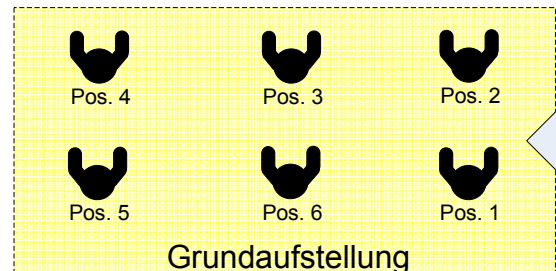
Logische Aufstellung, nach Positionsnummer.